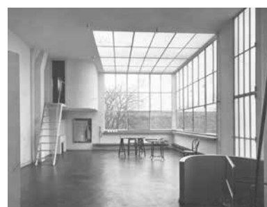
ル・コルビュジェ「アメデ・オザンファンの住宅兼アトリエ」 1922-23年設計

本展はル・コルビュジェと彼の友人たちの美術作品約100点に、建築模型、出版物、映像など多数の資料を加えて構成されます。ル・コルビュジェが世に出た時代の精神を、彼自身が作り出した世界遺産建築の中で体感できる、またとない機会となるでしょう。